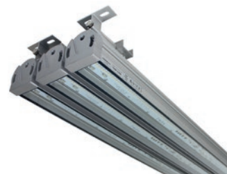
Gruppierung von Leuchten