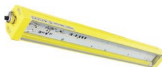
TANK DOB 2 Ex

Spezialisierte Leuchten unterliegen einer individuellen Bewertung.