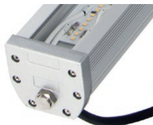
Aluminiumgehäuse / Gehärteter Glasdiffusor