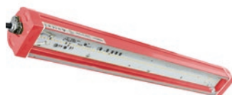
TANK DOB 2 HT